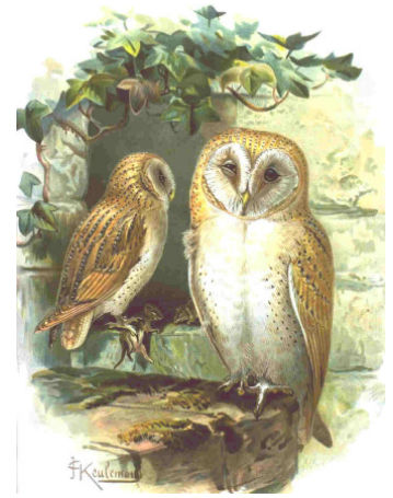
Naumann Naturgeschichte der Vögel Mitteleuropas

Die Schleiereule ernährt sich vorwiegend von Kleinnagern, vor allem der Feldmaus. Vögel nehmen nur einen geringen Teil des Nahrungsspektrums ein. Zur Jagd auf Feldmäuse braucht sie offene Kulturlandschaften, bevorzugt Dauergrünlandflächen und Streuobstwiesen. Nur in diesem Umfeld macht es auch Sinn, Nisthilfen anzubringen.